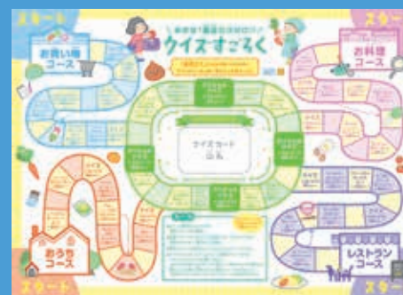
環境学習プログラム(クイズすごろく)